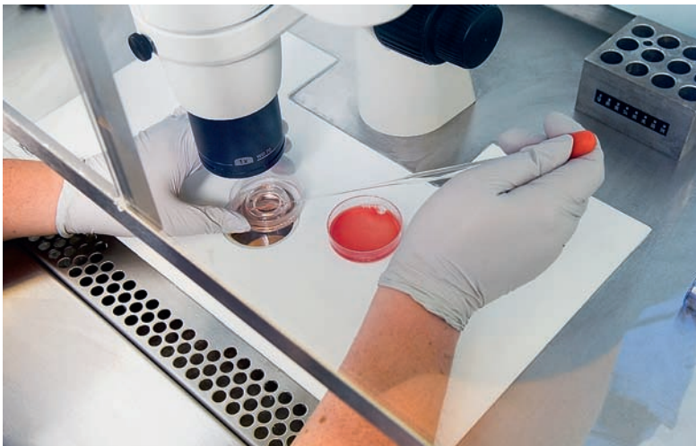
Labor-Test: Unter dem Mikroskop werden die Eizellen untersucht und getrennt