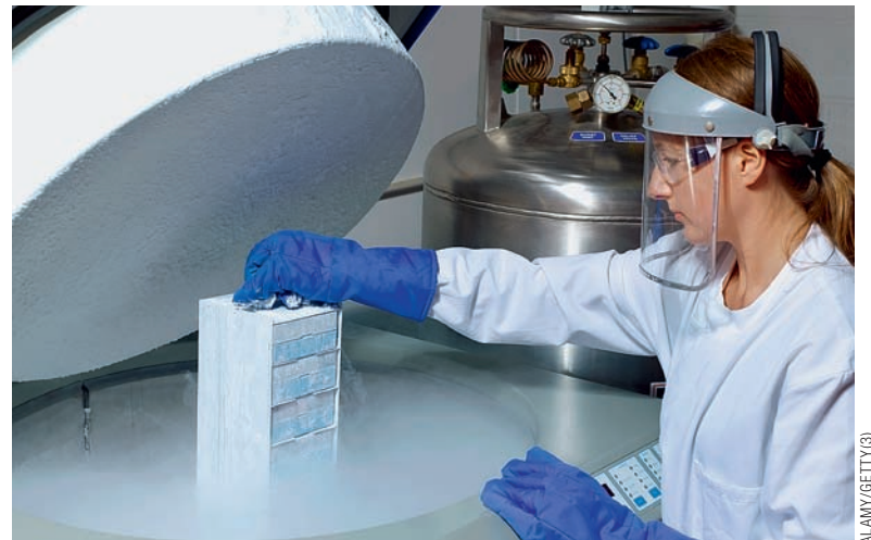
Lagern: Die Eizellen kommen in einen Behälter und werden dann in flüssigem Stickstoff aufbewahrt