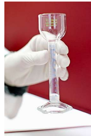
24 Stunden vor der Samenspende ist Sex tabu.